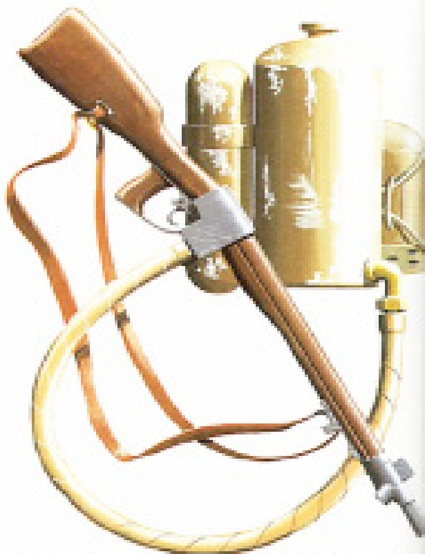
súng phun lửa ROKS2 của Nga Sô