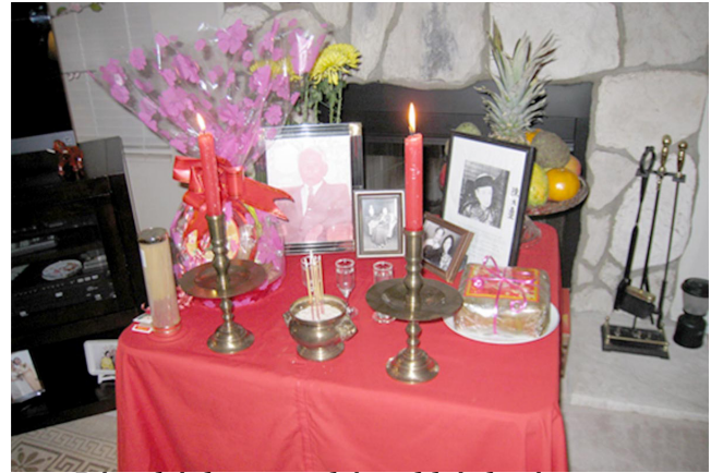
Bàn thờ lập tại phòng khách vào môi dịp Tết

— Mày thương mẹ lắm, sao không biết gì về lễ Vu Lan? Chắc từ nhỏ mày học trường Tây, mới qua trường Việt, nên không biết gì về mấy chuyện “điên cổ” này; để tao giảng cho mày nghe.