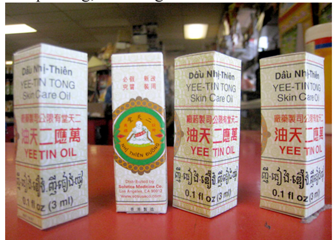
Những lọ dầu Nhị Thiên Đường gọi nhớ về mẹ

Vì ít khi có phép về thăm nhà, nên tôi thường xuyên viết thư về để gia đình được yên tâm. Qua thư tôi, tên các quận, các tỉnh, các thành phố (trong vùng tôi đang hành quân) cứ thường xuyên thay đổi xoành xoạch! Mẹ tôi ở nhà lo ghê lắm, chẳng biết tôi đang ở đâu qua các địa danh lạ lẫm mà mẹ chưa biết hoặc chưa nghe ai nói đến bao giờ! Mỗi lần biết tôi đang “ở” một “chỗ mới” nào đó, mẹ thường thắc mắc và than thở với các em tôi: “Mạ lần theo đường anh tụi con đi mà muốn bã hơi tai. Không biết anh tụi con mần cái chi mà cứ đi tam phương, tứ hướng sa đà như rứa!”